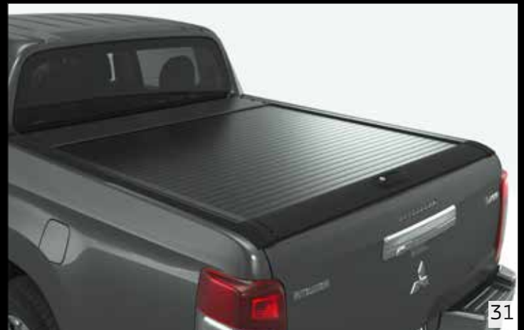
▲ Rollcover, Schwarz DC

Nähere Informationen entnehmen Sie dem Teilenummernverzeichnis.