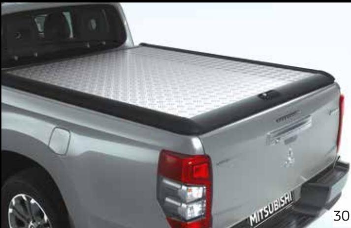
▲ Laderaumabdeckung Alucover DC/CC

Nähere Informationen entnehmen Sie dem Teilenummernverzeichnis.