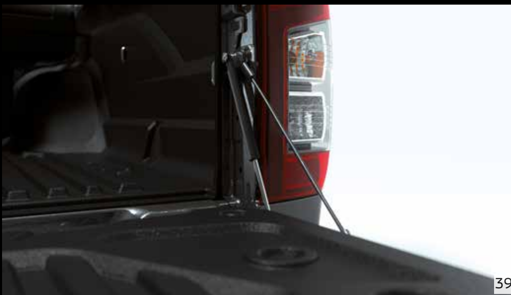
◀ Heckklappenlift CC / DC MZ315094