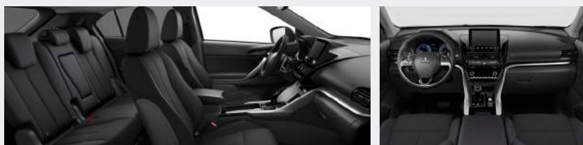
INTENSE Stoffsitze schwarz