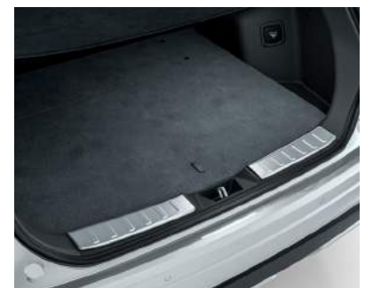
▲ Ladekantenschutz Edelstahl.