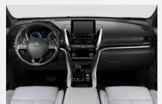
DIAMOND Ledersitze schwarz oder grau