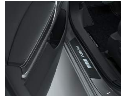
▲ Einstiegsleisten-Satz Carbon Design mit PHEV Logo