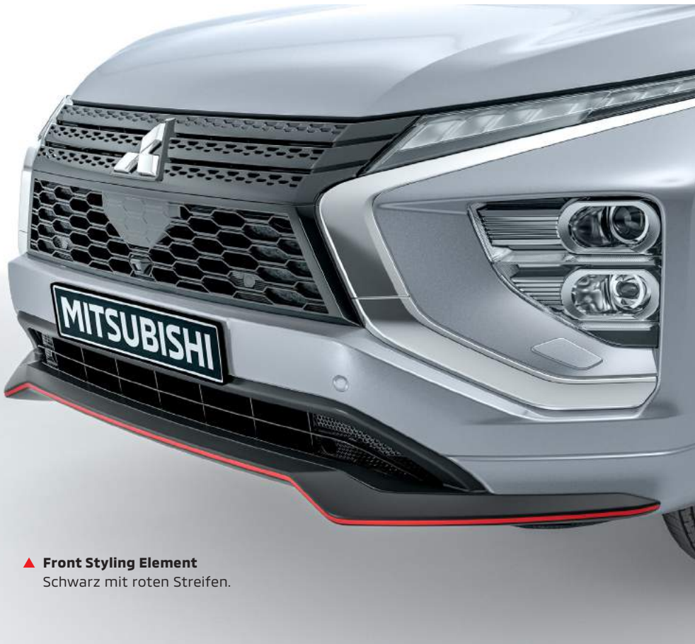
▲ Front Styling Element Schwarz mit roten Streifen.

Mitsubishi-Modelle sind bereits serienmäßig sehr gut ausgestattete Fahrzeuge. Darüber hinaus gibt es eine Vielzahl an Zubehör, um Ihren Mitsubishi noch individueller zu gestalten. Sie finden nachstehend eine Auswahl an Zubehörartikeln. Ihr Mitsubishi-Händler informiert Sie gerne. Weitere Informationen finden Sie auch auf mitsubishi-motors.at .