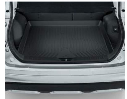
▲ Laderaumwanne mit Mitsubishi Motors Logo.