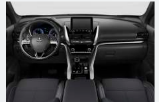
INTENSE+ Sitze aus synthetischem Leder schwarz