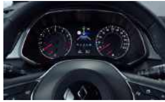
INFORM & INVITE ▲ 4,2" Analoges Kombiinstrument: Kombination aus analogen Zeigern und digitalem Farb-Display