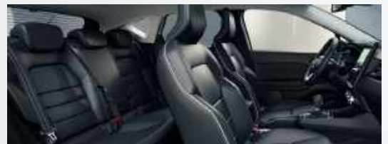
DIAMOND Ledersitze schwarz