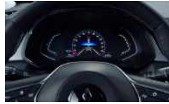
INVITE (nur für Hybrid HEV) ▲ 7" Digitales Farb-Display: Konfigurierbarer und personalisierbarer Screen