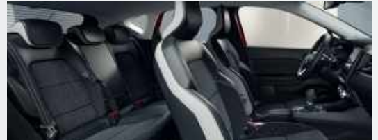
INTENSE Stoffsitze dunkelgrau mit Ledernachbildung hellgrau/schwarz