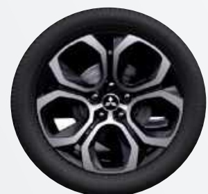
18" Leichtmetallfelgen ▲ Diamanten-cut in silber/schwarz Intense, Diamond