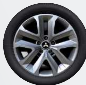
17" Flex Wheel ▲ Stahlfelge mit Spezial-Zierkappe Inform, Invite