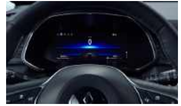
INTENSE & DIAMOND ▲ 10,25" Digitales Farb-Display: Personalisierbarer Screen, ermöglicht Navigations- Anzeige