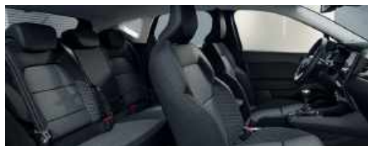
INFORM &amp; INVITE Stoffsitze grau/schwarz