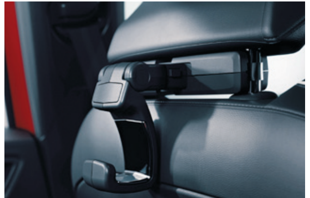
▲ Reise- & Komfortsystem Haken. MME03C04