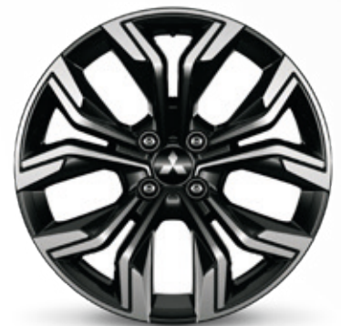
▲ Leichtmetallfelge 17" Black diamond cut finish. MQ006665. Empfohlene Reifengröße: 205/45 R17