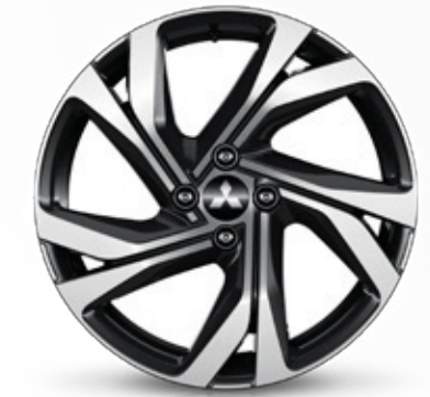
▲ Leichtmetallfelge 17" Black diamond cut. MZ315420 Empfohlene Reifengröße: 205/45 R17