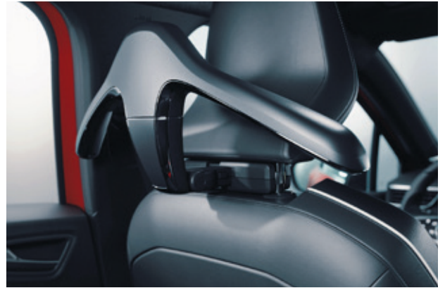
▲ Reise- & Komfortsystem Kleiderbügel. MME03C03