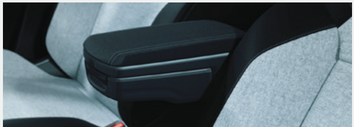
▲ Mittelarmlehne Mit Stauraum. MZ315423