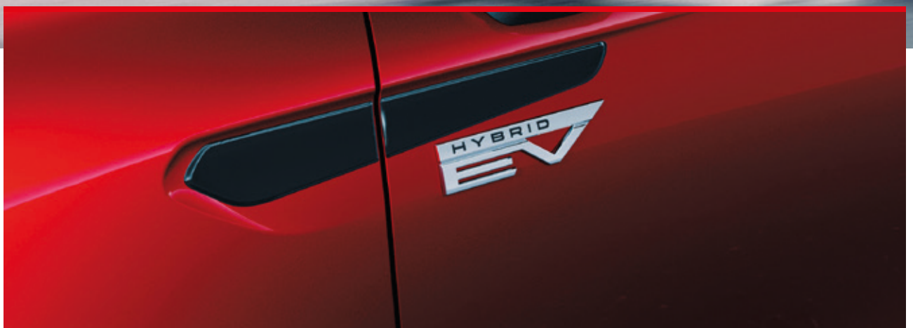
▲ Seitliches Designelement Piano Black. MZ315452