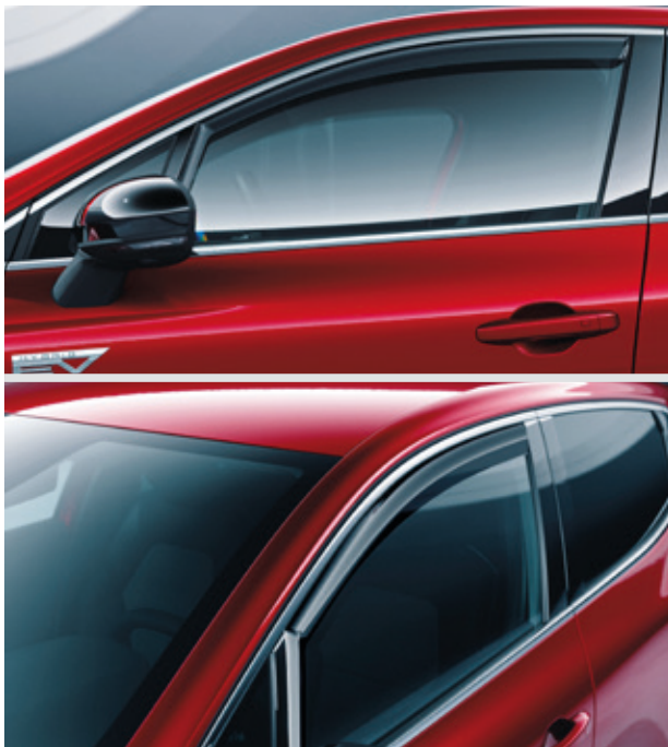
▲ Seitenwindabweiser Für die vorderen Seitenfenster. MZ315439