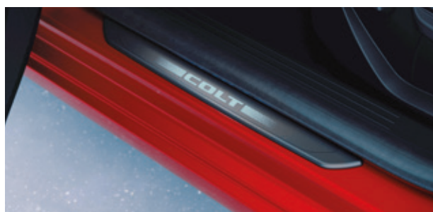
▲ Einstiegsleisten Kunststoff. Beleuchtet. MZ315429