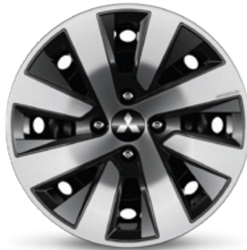
▲ Radzierblende 15" Silver. MQ006666