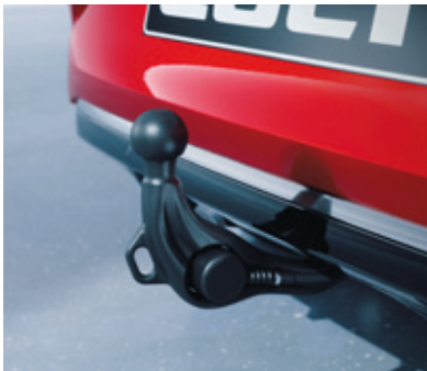
▲ Anhängervorrichtungspaket Schwenkbar MZ315442K1

*Sofern das Zubehör vor Neuwagenauslieferung verbaut wurde.