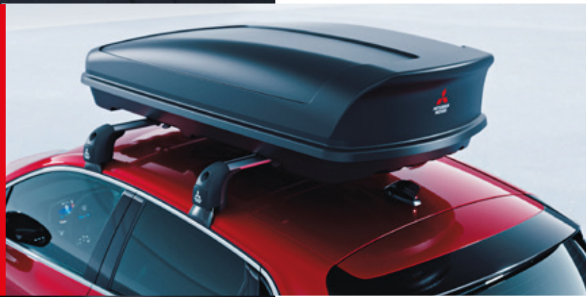
◀ Dachbox 480 Liter. MZ315377