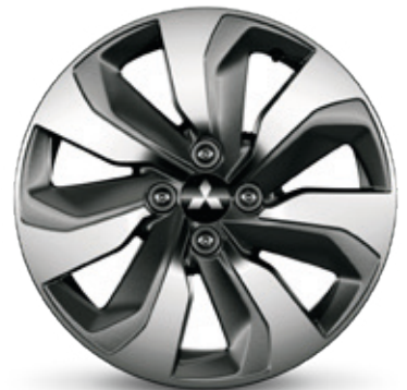
▲ Leichtmetallfelge 16" Grey diamond cut finish. MZ315418. Empfohlene Reifengröße: 195/55 R16