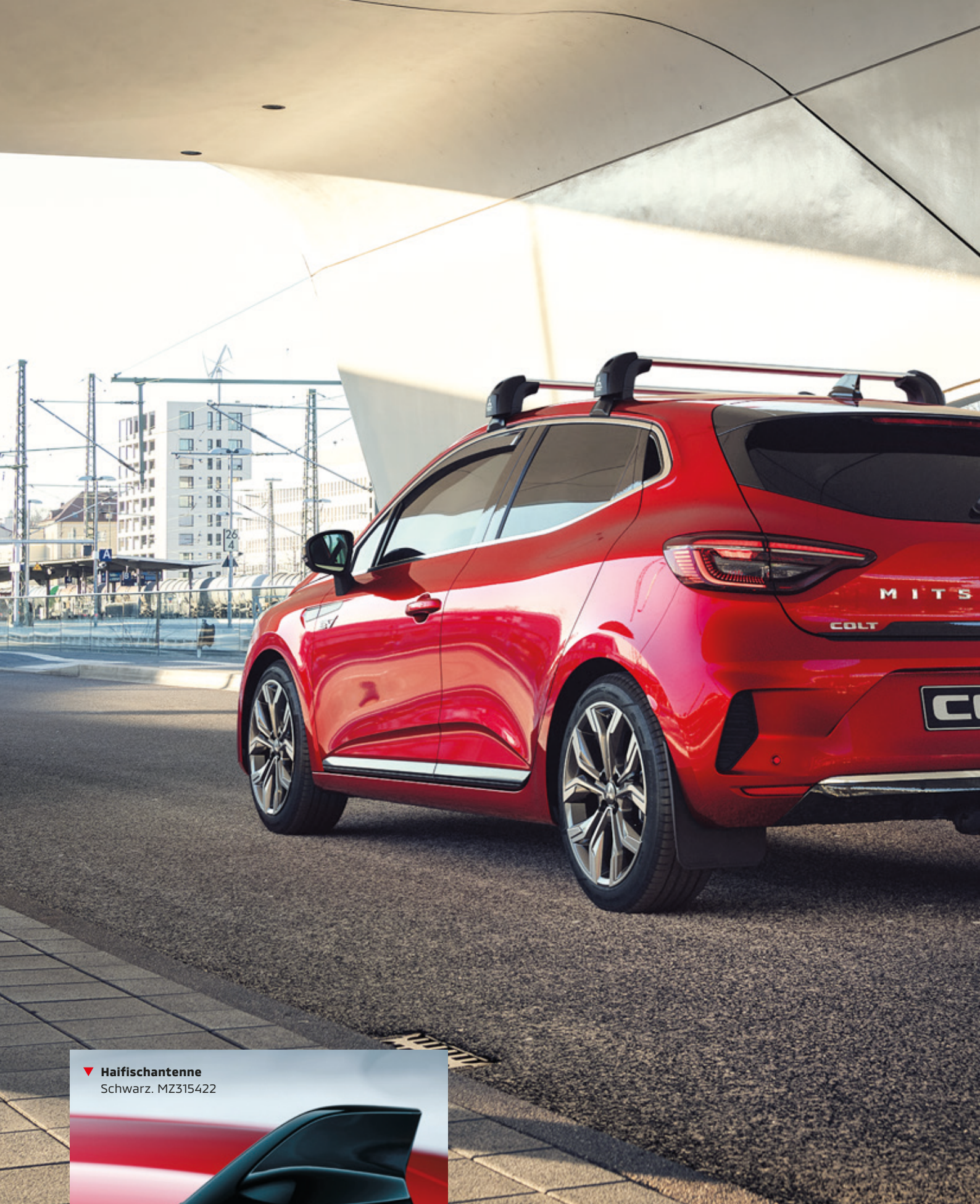
▼ Haifischantenne Schwarz. MZ315422