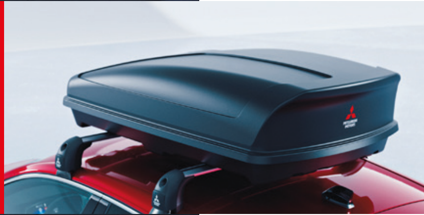
◀ Dachbox 380 Liter. MZ315376