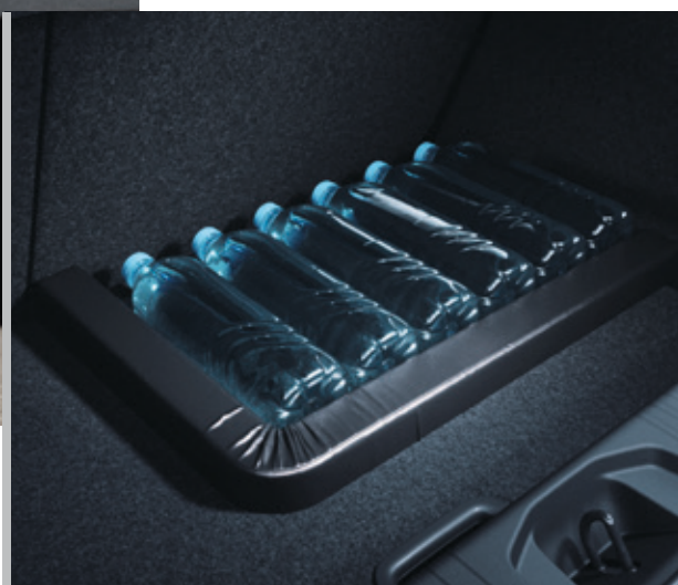
▲ Laderaumtrenner MZ315394