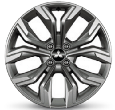
▲ Leichtmetallfelge 17" Grey diamond cut finish. MZ315419. Empfohlene Reifengröße: 205/45 R17