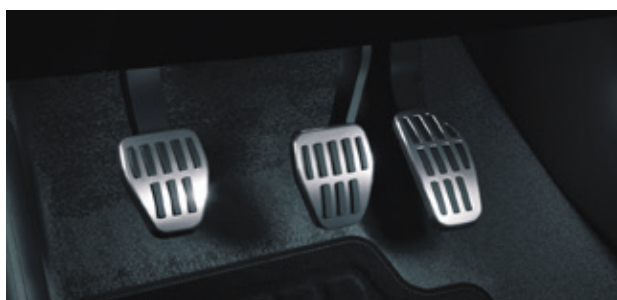
▲ Sportpedale Gebürstetes Aluminium - für Schaltgetriebe. MZ315385