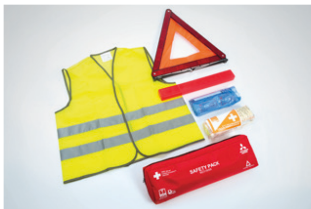
▲ Erste Hilfe-Kombi Paket Verbandstasche, Warndreieck und Warnweste. MZ315059