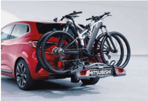
▲ Heckfahrradträger Für bis zu 2 Fahrräder. MZ314957