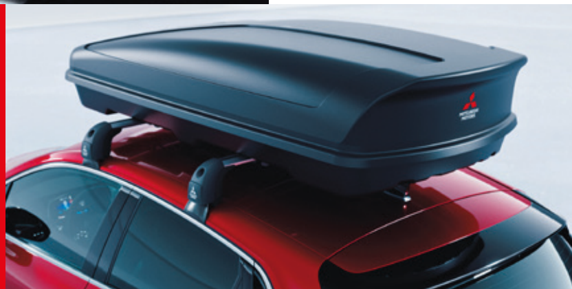
◀ Dachbox 630 Liter. MZ315378