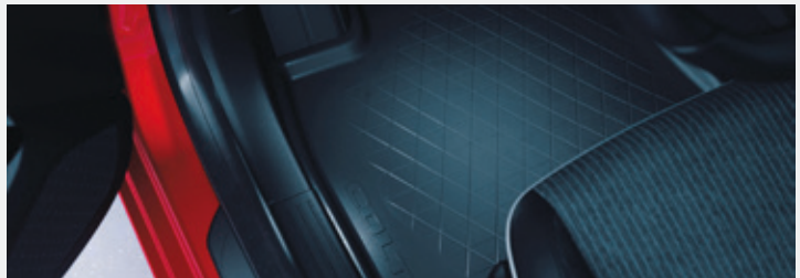
▲ Gummi-Fußmatten MZ315430