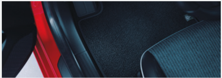
▲ Textil-Fußmatten Comfort. MZ315433.