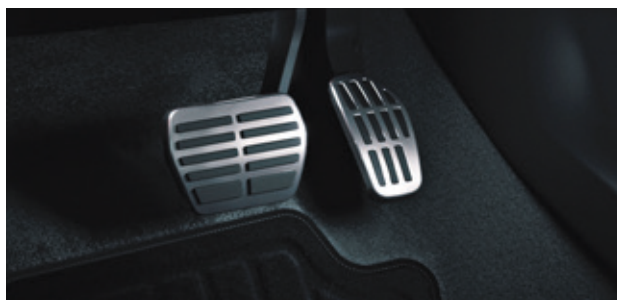
▲ Sportpedale Gebürstetes Aluminium - für Automatikgetriebe. MZ315386