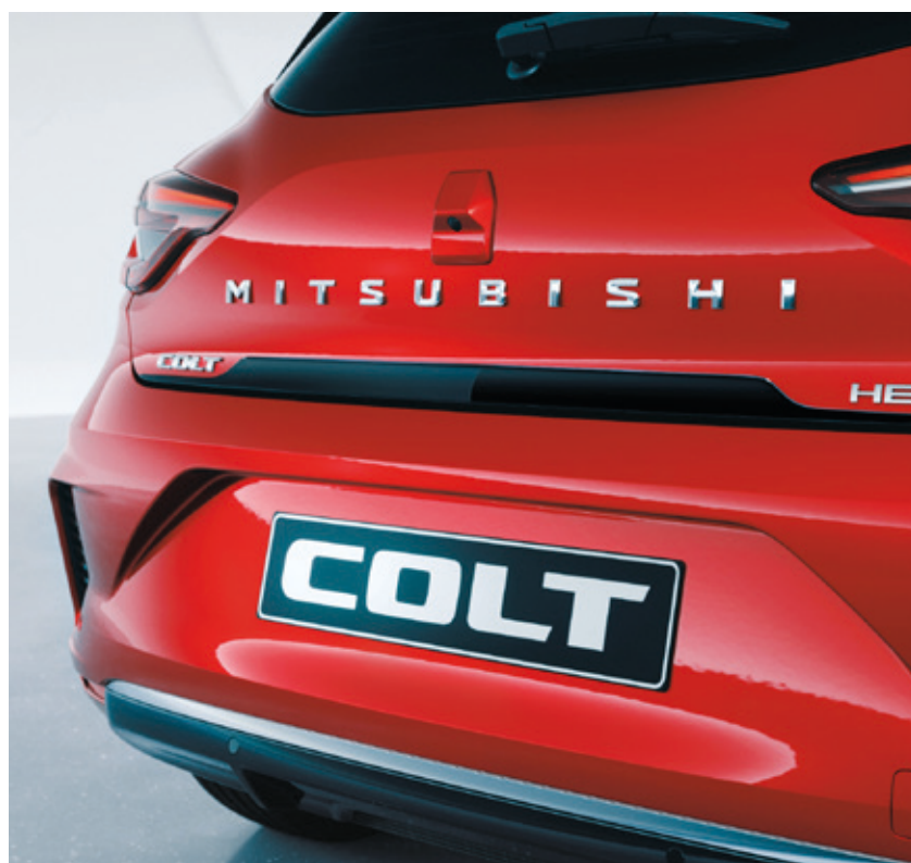
▲ Heckklappenzierleiste Piano Black. MZ315407B