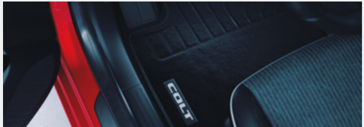
▲ Textil-Fußmatten Elegance. MZ315432.