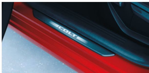
▲ Einstiegsleisten Kunststoff. MZ315428