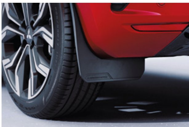
▲ Schmutzfänger-Set Für vorne und hinten. MZ315356