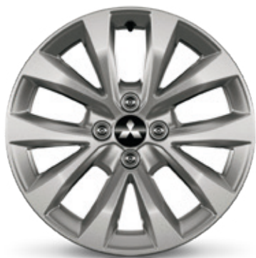
▲ Leichtmetallfelge 16" Silver finish. MZ315417. Empfohlene Reifengröße: 205/45 R17