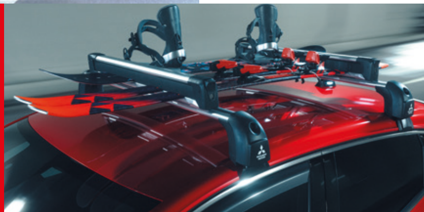
◀ Grundträger Quick fix. MZ315448