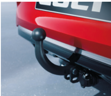
▲ Anhängervorrichtungspaket Starr MZ315440K1