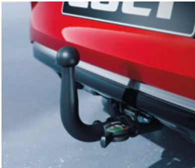
▲ Anhängervorrichtungspaket Abnehmbar MZ315441K1