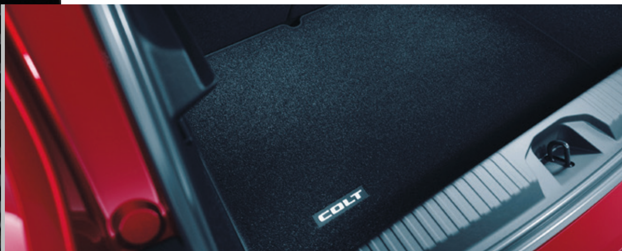
▲ Kofferraummatte MZ315434