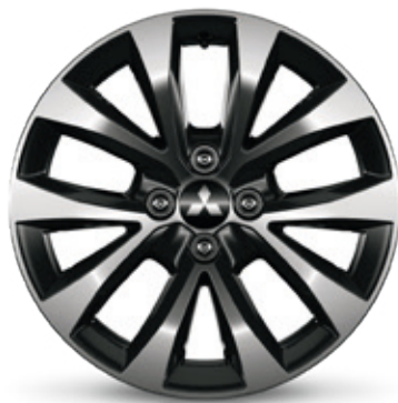
▲ Leichtmetallfelge 16" Black diamond cut finish. MQ007864. Empfohlene Reifengröße: 205/45 R17