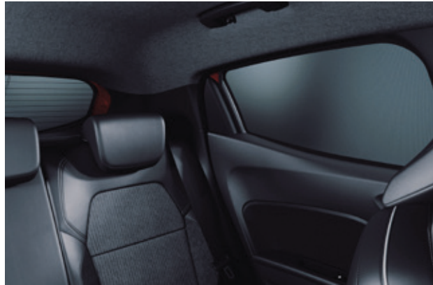
▲ Sonnenblenden Für Seitenfenster und hintere Fenster. MZ315437