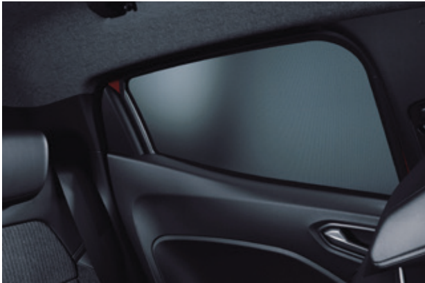
▲ Sonnenblende Für Seitenfenster. MZ315438