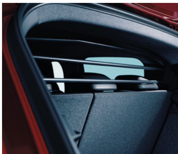
▲ Trenngitter Schwarz. MZ315425