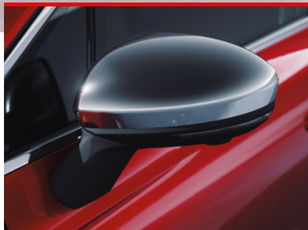
▲ Spiegelkappen-Set Chrom. MZ315421