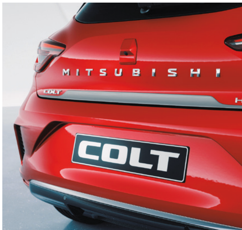
▲ Heckklappenzierleiste Gebürstetes Silber. MZ315407S