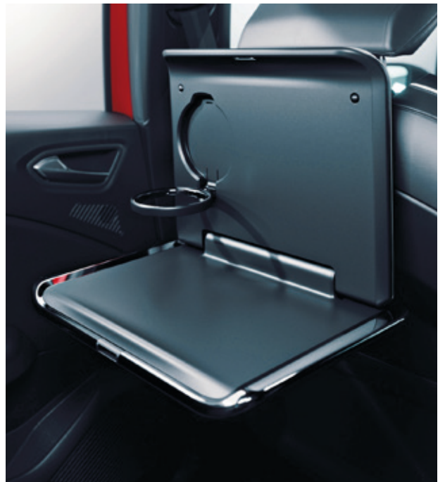
▲ Reise- & Komfortsystem Einklapptisch. MME03C05