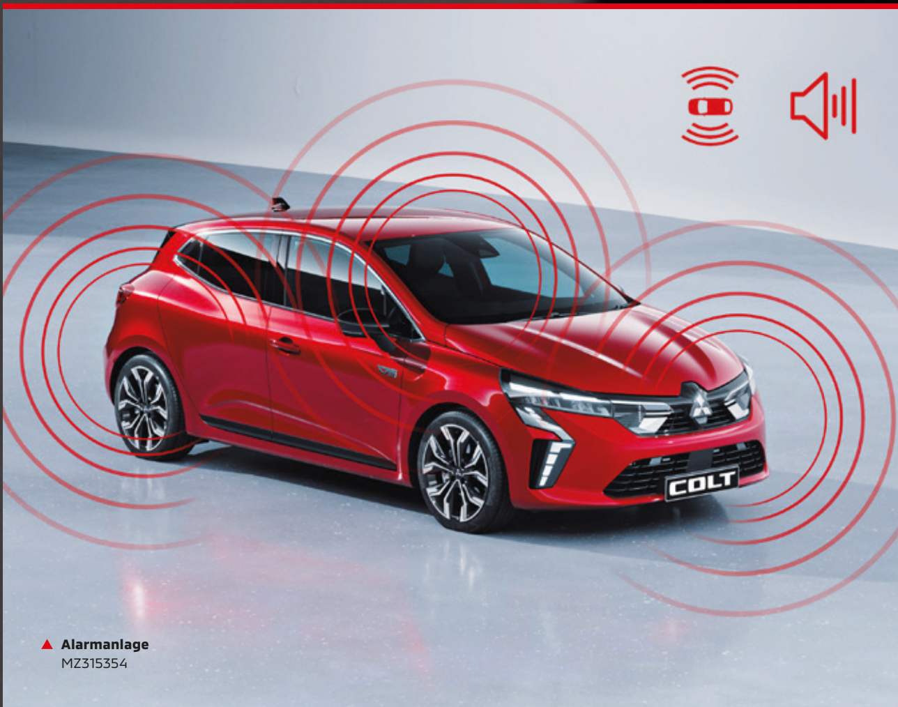
▲ Alarmanlage MZ315354