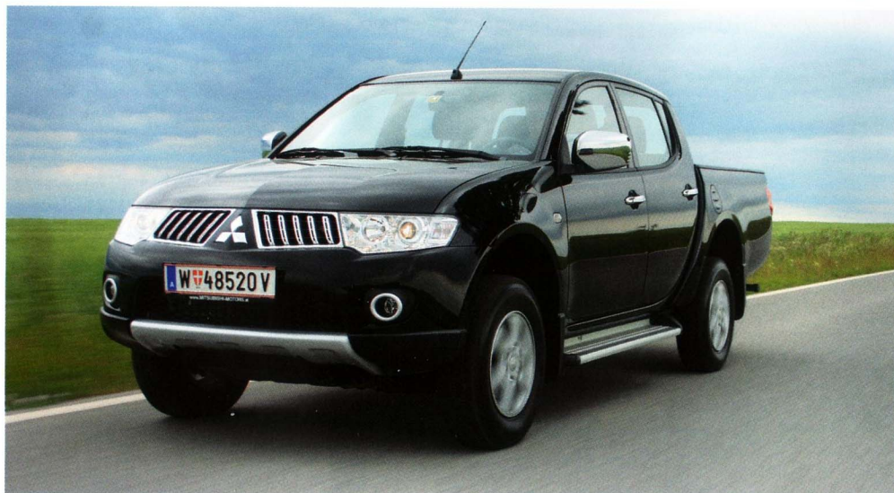
Auch Family nutzbar - die Wochenenden können so sehr viel Spaß machen